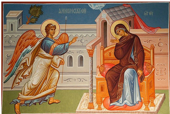
Благовещение Пресвятой Богородицы