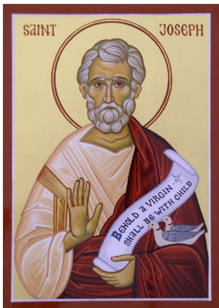
Праведный Иосиф Обручник

14. Обрезание Иоанна Предтечи. Пророческая песнь Захарии. Во время чина обрезания в Ветхом Завете совершалось и наречение имени. При наречении имени срок наказания Захарии истёк: «разрешились уста его и язык его, и он стал говорить, благословляя Бога» (Лк. 1: 64). В последовавшей сразу затем вдохновенной пророческой песни, св. Захария называет сына своего «пророком Всевышнего» (Лк. 1: 76).